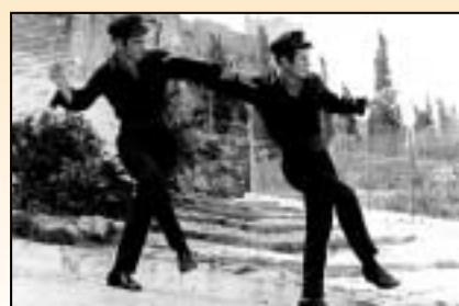
Σύγχρονοι Ζορμπάδες, χασάπικο