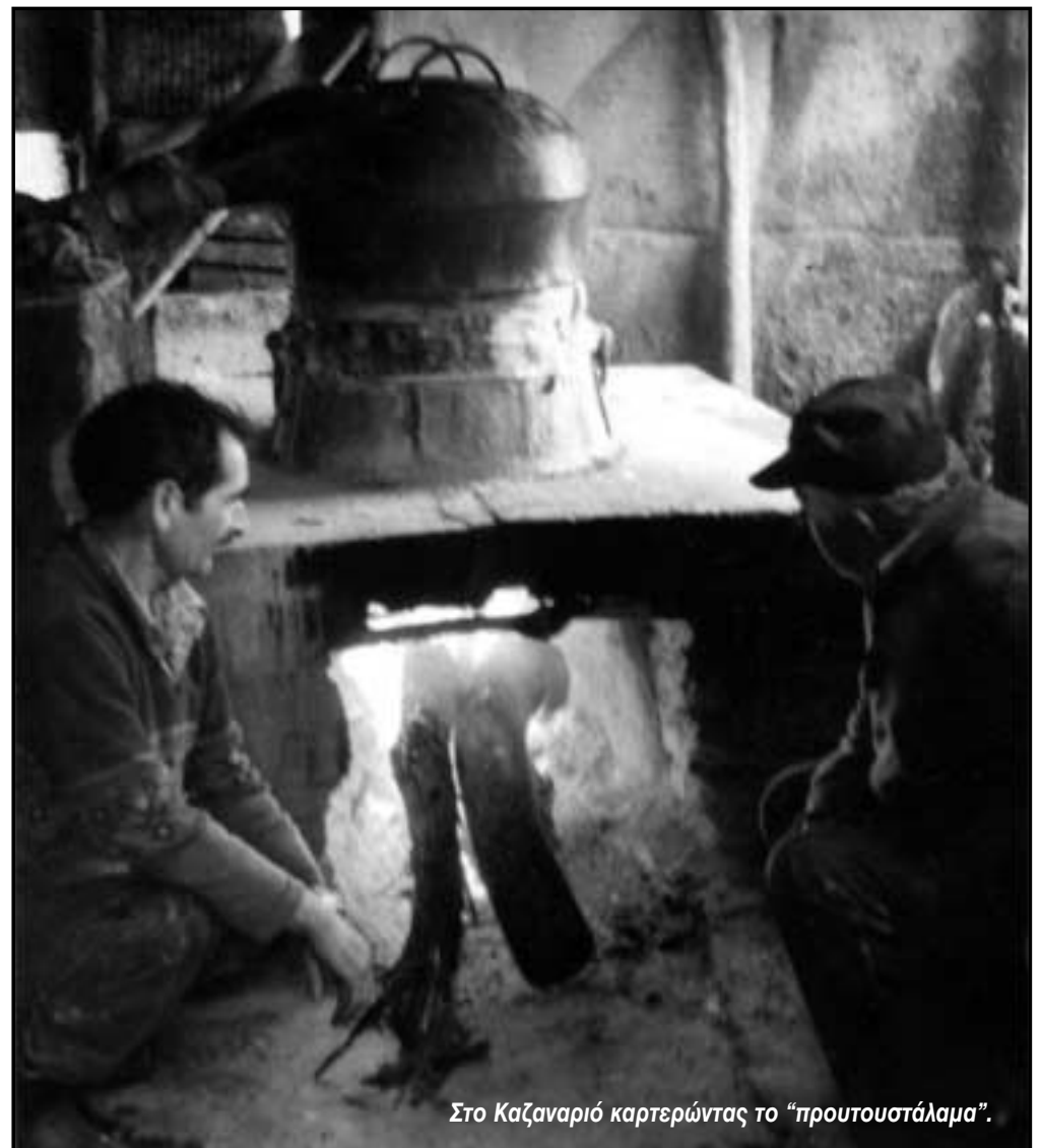
Στο Καζαναριό καρτερώντας το "προυτουστάλαμα".

απόμναν, τ'νι η κάβουρας τ'νι του ζμί τ';»