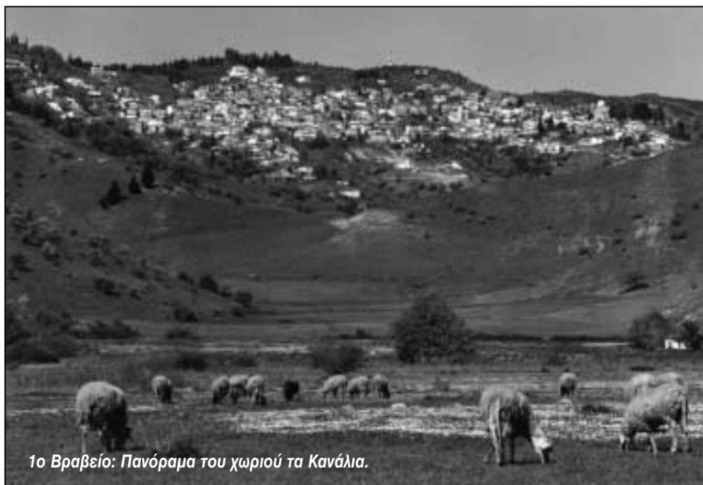
1ο Βραβείο: Πανόραμα του χωριού τα Κανάλια.