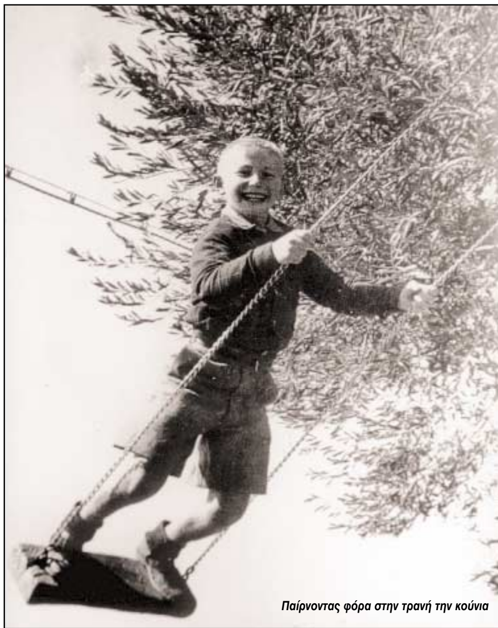
Παίρνοντας φόρα στην τρανή την κούνια

- «Ιγώ να ιδείτι νια κασκαρίκα από'παθα, δε μπουρώ ακόμα να του χουνέψω...» μουλουγούσι η Τάκουσ. «...Ικει άπίλέτι που μπήκα μέσα για πλέεις κ' ήμαν μι του νιρό ωε τουν αφαλό, μ'έπιαισι ένα αγράπουμα στην κ'λιά κι μ'ήρθι ν'απουπατώσου.